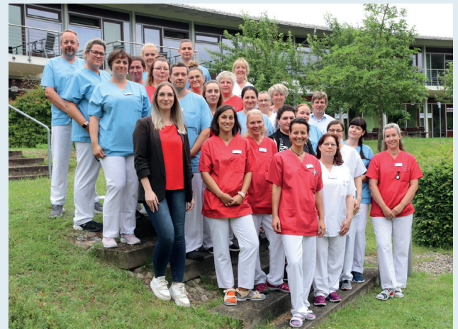
Ein großer Teil des Teams der Bethesda Klinik

mit Industrierausstellung sowie fachlichem bzw. persönlichem Austausch bei einem Imbiss